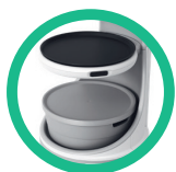
Plateaux ronds & bassines