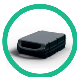
Batterie & chargeur